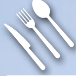
Çatal-bıçak, tabak, pipet ve içecek karıştırma çubukları

Plastikten yapılan tek kullanımlık kulak temizleme çubukları yasaklanacak ve piyasaya sürdürülebilir alternatifleri sürülecektir.