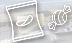
Çips ve şekerleme paketleri

Yürürlükteki Plastik Poşet Direktifi'nde yer alan mevcut tedbirlerin yanı sıra hafif plastik poşet üreticileri, farkındalık yaratma, temizleme, toplama ve atık işleme faaliyetlerine katkı koyacaklardır.